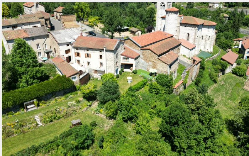
Crédit photo : Le jardin et la maison vus du ciel (Marie Paule DAUPHIN)