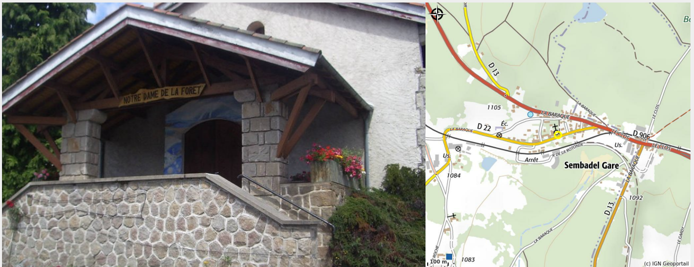
Crédit photo : Chapelle Notre-Dame de la Forêt_Sembadel (@copyright)

Très belle chapelle en bois du XXème siècle. Très originale de par son mobilier rustique tout en bois symbolisant l'environnement forestier, vitraux.