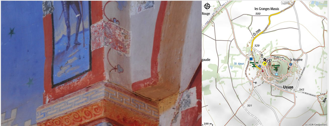
Crédit photo : église Saint Maurice à Usson (@N.Dutranoy église Saint Maurice à Usson)

Situé à Usson, l'un des "Plus Beaux Villages de France", l'église Saint-Maurice du 11ème et 12ème siècle est inscrite à l'inventaire des Monuments Historiques et recèle d'objets précieux, également classés Monuments Historiques.