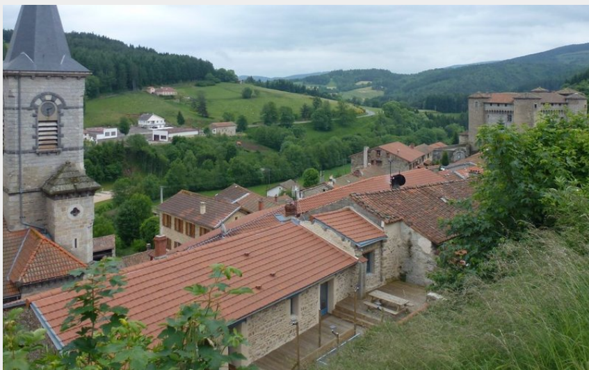
Crédit photo : L'église de Chalmazel (Commune de Chalmazel-Jeansagnière)